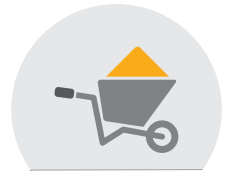
MATÉRIAUX DE CONSTRUCTION