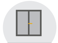
ÉTANCHÉITÉ DE L'AIR