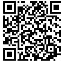
TABLEAU E/R NOTICE B.LM DTE JEFCOTHERM

En l'absence de normes européennes de travaux, l'usage prévu s'entend comme fait en France par référence aux documents techniques d'emploi qui lui sont attachés, soit selon le cas : NF DTU 26.1, NF DTU 59.1, NF DTU 42.1, Règles professionnelles « ETICS E/R », Tableau d'emploi selon ces règles, ou DTE JEFCOTHERM pour l'emploi en enduit de base d'ETICS, ces trois derniers directement consultables par voie électronique au moyen du QR CODE ci-contre ou sur le site www.jefco.fr .