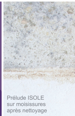
Prélude ISOLE sur moisissures après nettoyage