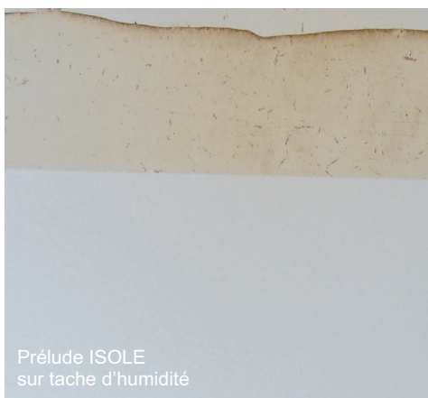
Prélude ISOLE sur tache d'humidité