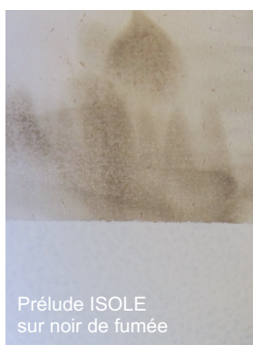
Prélude ISOLE sur noir de fumée